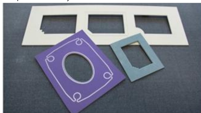
Aplikacje: rozkrój płyt do produkcji ram obrazów.