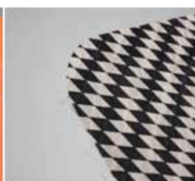
4 Materiały do produkcji balonów