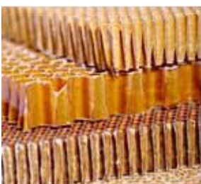
2 Plaster miodu

Płyty kartonowe, tektury, tworzywa sztuczne lub aluminium.