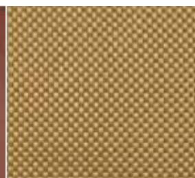
5 Włókno aramidowe

Półprodukt do produkcji włókien węglowych, szklanych, jak również nieutwardzonych duro- lub termoplastycznych form.