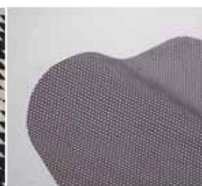
5 Materiały do produkcji zasłon