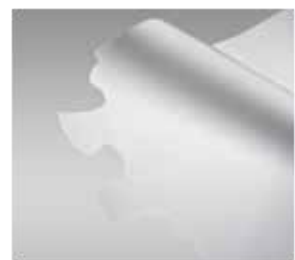
1 Folia PVC gładka lub z nadrukiem.

Maksymalna szerokość stołu roboczego dochodząca do 3.2m, automatyczna zwijarka materiału i szereg innych udogodnień do zdalnego dystrybuowania materiałami w rolkach, to tylko niektóre cechy, dzięki którym obróbka materiałów nawiniętych na duże, nieporęczne belki, takich jak folia PVC lub planeki samochodowe, staje się prosta i efektywna. Proces rozkroju cyfrowego pozwala na uzyskanie znacznie krótszych czasów rozkroju, większej dokładności i powtarzalności cięcia, aniżeli w przypadku obróbki ręcznej materiału.