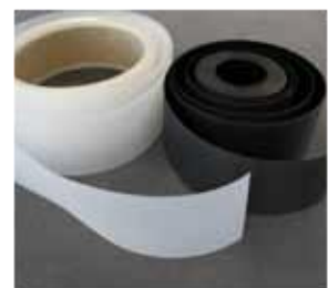
1 Materiały syntetyczne PE, PP, PUR, PVC.

Plotery Zünd cechują się budową modułową, co niewątpliwie zwiększa ich funkcjonalność i pozwala na dopasowanie do zmiennych wymagań rozkroju. Urządzenia serii G3 i S3 spełniają rygorystyczne normy bezpieczeństwa oraz posiadają prestiżowy certyfikat UL, co stanowi potwierdzenie ich wyjątkowej, szwajcarskiej jakości. Zunifikowany interfejs Zünd Cut Center gwarantuje pełne wsparcie dla wielu formatów plików oraz platform systemowych. Tysiące zainstalowanych i bezawaryjnie działających systemów Zünd do zastosowań przemysłowych na całym świecie stanowią najlepszą rekomendację naszych sprawdzonych rozwiązań technicznych.