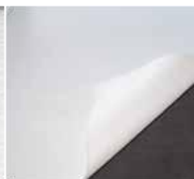
5 Materiały filtracyjne filc, papier, materiały syntetyczne.