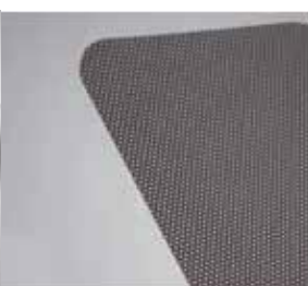
2 Tkaniny odzieżowe

bawełna, polyester, welur, mikrofibra, materiały frottowe.