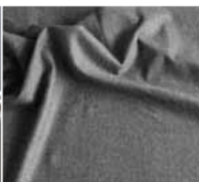
3 Folie elastyczne elastan, spandex, materiały przekładkowe.