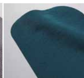
6 Materiały filcowe

włóknina bawełniana, materiały syntetyczne.