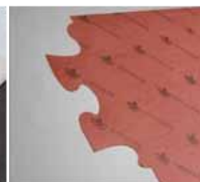
Materiały uszczelniające papier, guma, silikon, korek.