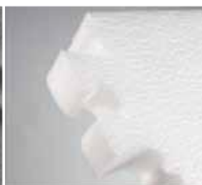
4 Materiały piankowe polistyren, poliuretan, polipropylen.