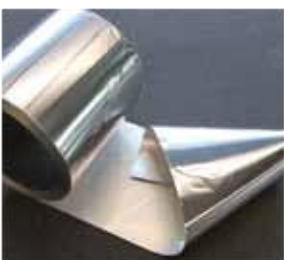
2 Folie metalowe folia aluminiowa, folia miedziana.