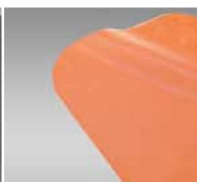
3 Materiały zbrojone

bawełna, polyester, welur, mikrofibra, materiały frottowe.